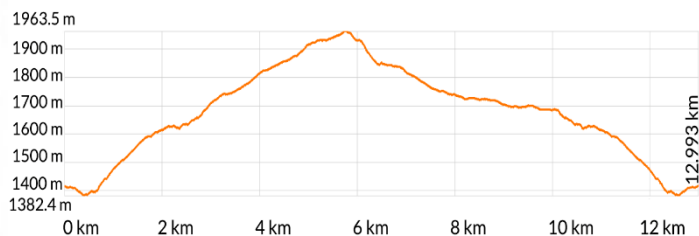
Altimetría PR-TF 72: Vilaflor - Paisaje Lunar - Vilaflor